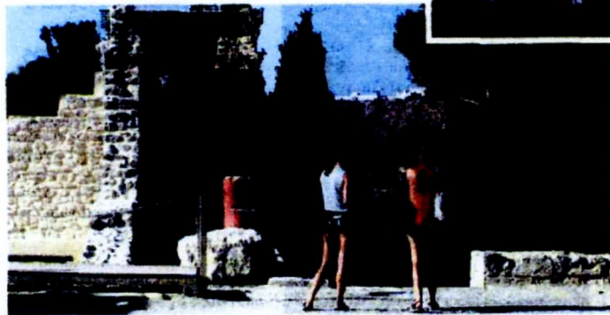
Κλέβει τα βλέμματα και το πρωτότυπο έργο «ΑλάτΞ στην Κνωσό»

σφέρονται στον βιωμό της τέχνης στο πλαίσιο ενός προγράμματος που «απτάει» ανανέωση και αναμόρφωση. Από