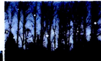
Το εδουλλιακό έργο της ελληνικής γκαλερί «ΑλάτΞ», με τοξό των υπόλοιπων εκθετών

τίς 8 Σεπτεμβρίου έως και τις 24 Νοεμβρίου 2007, περισσότεροι από 170 καλλιτέχνες από όλον τον κόσμο εκθέτουν τα έργα τους σε διάφορα ση-